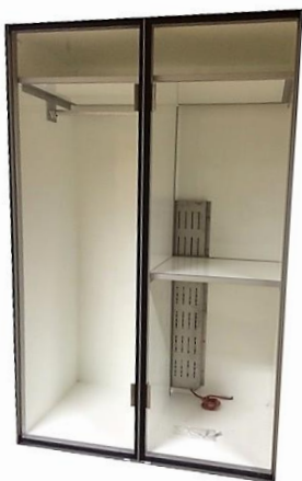
Med innredning og varme