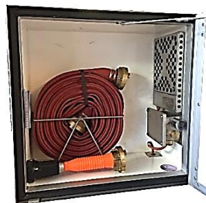
Slangeskap med varme