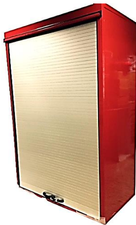
Skap med rulleport. Lakkert eller alufarget